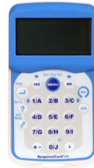
XR ResponseCard RF Benutzerhandbuch

E-Mail-Adresse des Kundendienstes: support@turningtechnologies.com